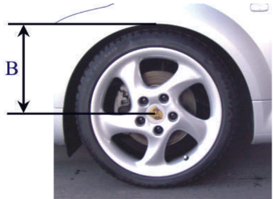
Measurement B Wheel hub center wheel arch

Please enter the adjusted height of the modified car into the list: